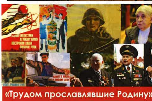
«Трудом прославлявшие Родину»